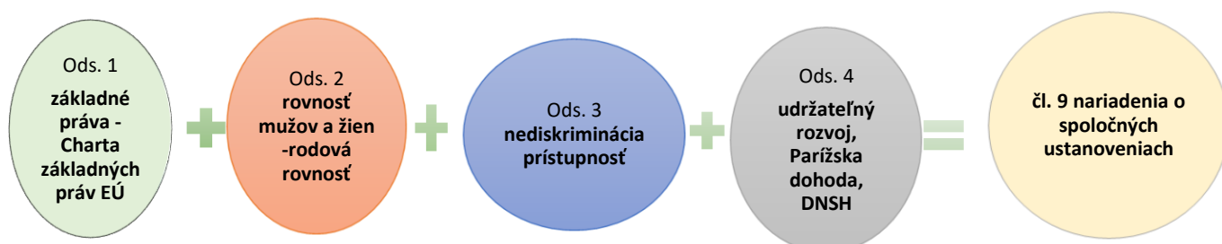
Obrázok: podľa Systému implementácie HP .